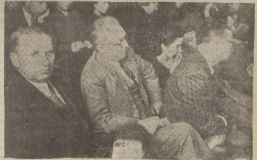
Evvelki günkü mahkemede samlin arasında bulunan ve muhakemeyi dinliyen Sovyet ajansı Tasın memurları

Ankara 16 (Hususi) — Yakında Rejime mahkemesi bu mevsim haftalarca meraklı dava celselerinin cereyanına sahne oluyor demektir. Dün bir buğuk de aynı mahkemede başlayacağından a. (Devamı 4/1 de)